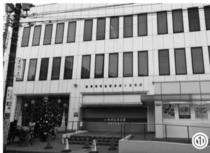
自由が丘駅周辺 一時避難場所 (2017年1月現在)

ので、駒沢オリンピック公園一帯は14万8900人を収容することができる。ただし、高齢者、障害者妊婦、乳幼児などの災害時要配慮者については、季節や条件によっては同公園までの移動が難しいことが想定される。そこで、移動距離が短い駅周辺で一時的に避難者を受け入れ、水や食料の備えもある「一時避難所」が必要となる。