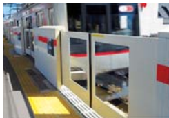
学芸大学駅ホームドア

また、踏切の安全対策として、3D式踏切障害物検知装置を池上線の6カ所に新設を予定するなど、鉄道運転事故・輸送障害の未然防止を図ります。