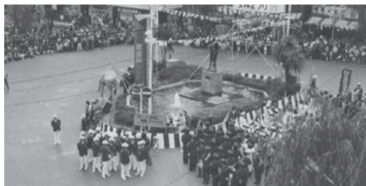
1973年「第1回女神まつり」当時は駅前式典やパレードを行った

継承し継続する力と、変化を恐れず絶えず進化を目指す街の新鮮さを、第50回女神まつりで併せて感じてもらいたいと思います。