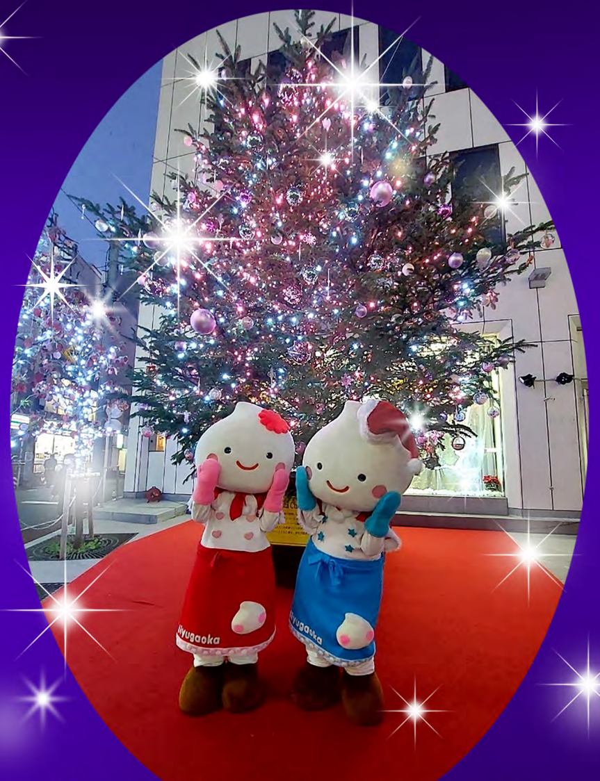
2023年のイルミネーションと ホイップるん